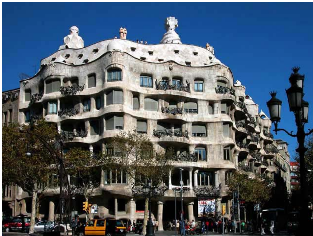
IMATGE 1 / IMAGEN 1

Casa Milà, Antoni Gaudí. Barcelona. 1906-1912.