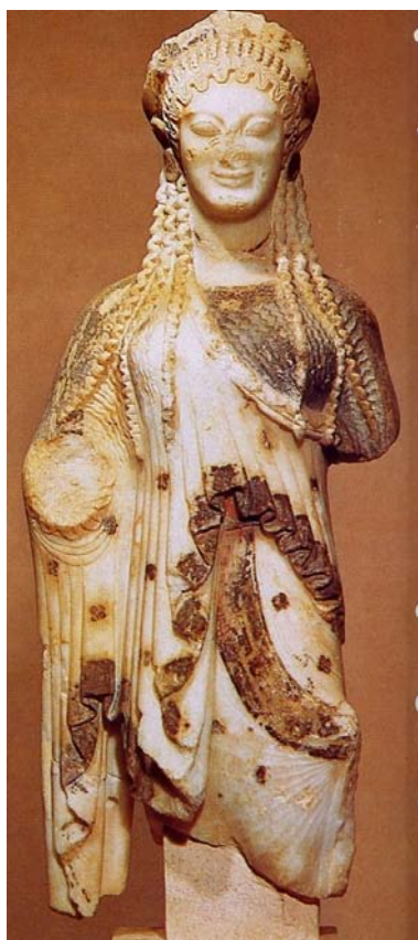
IMATGE 3 / IMAGEN 3