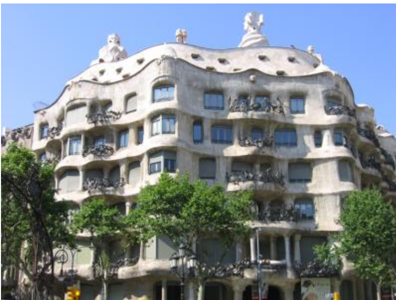
Fig.1 Puntuación máxima: 2 puntos

Analiza y comenta las dos obras de arte presentadas: