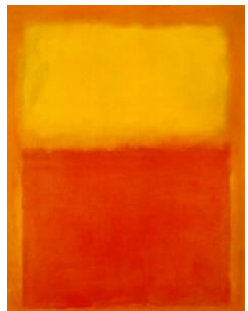
Fig.2 Puntuación máxima: 2 puntos