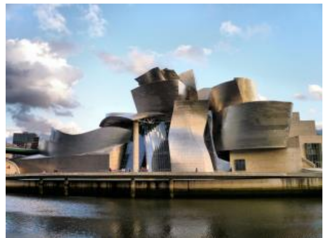
Fig.2 Puntuación máxima: 2 puntos