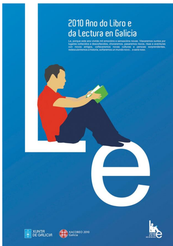
Cartel Deseño de José Antonio Pérez Gil. Realizado para promocionar o Ano da lectura.

1.2. Partindo da análise e comentario crítico anterior, deseñe outro cartel da serie, para o ano 2020, considerando un neno e un conto como personaxe e elemento de apoio. / Partiendo del análisis anterior y comentario crítico, diseñe otro cartel de la serie, para el año 2020, considerando un niño y un cuento como personaje y elemento de apoyo. (7 puntos: bosquejos/bocetos 2, proposta/propuesta final 3, presentación 2).