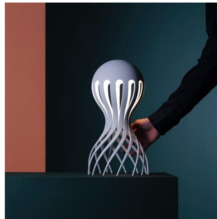
Lámpada CIRRATA Deseño de Markus Johansson

2.2. Partindo da análise e comentario crítico anterior, faga unha proposta de deseño para unha lámpada da mesma serie e inspirada noutro animal mariño como, por exemplo, unha medusa ou un calamar (podes propoñer outro). / Partiendo del análisis y comentario crítico anterior, haga una propuesta de diseño para una lámpara de la misma serie e inspirada en otro animal marino como, por ejemplo, una medusa o un calamar (puedes proponer otro). (7 puntos: bosquejos/bocetos 2, proposta/propuesta final 3, presentación 2)