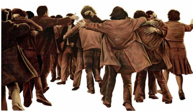
Cuadro El Abrazo , Juan Genovés.